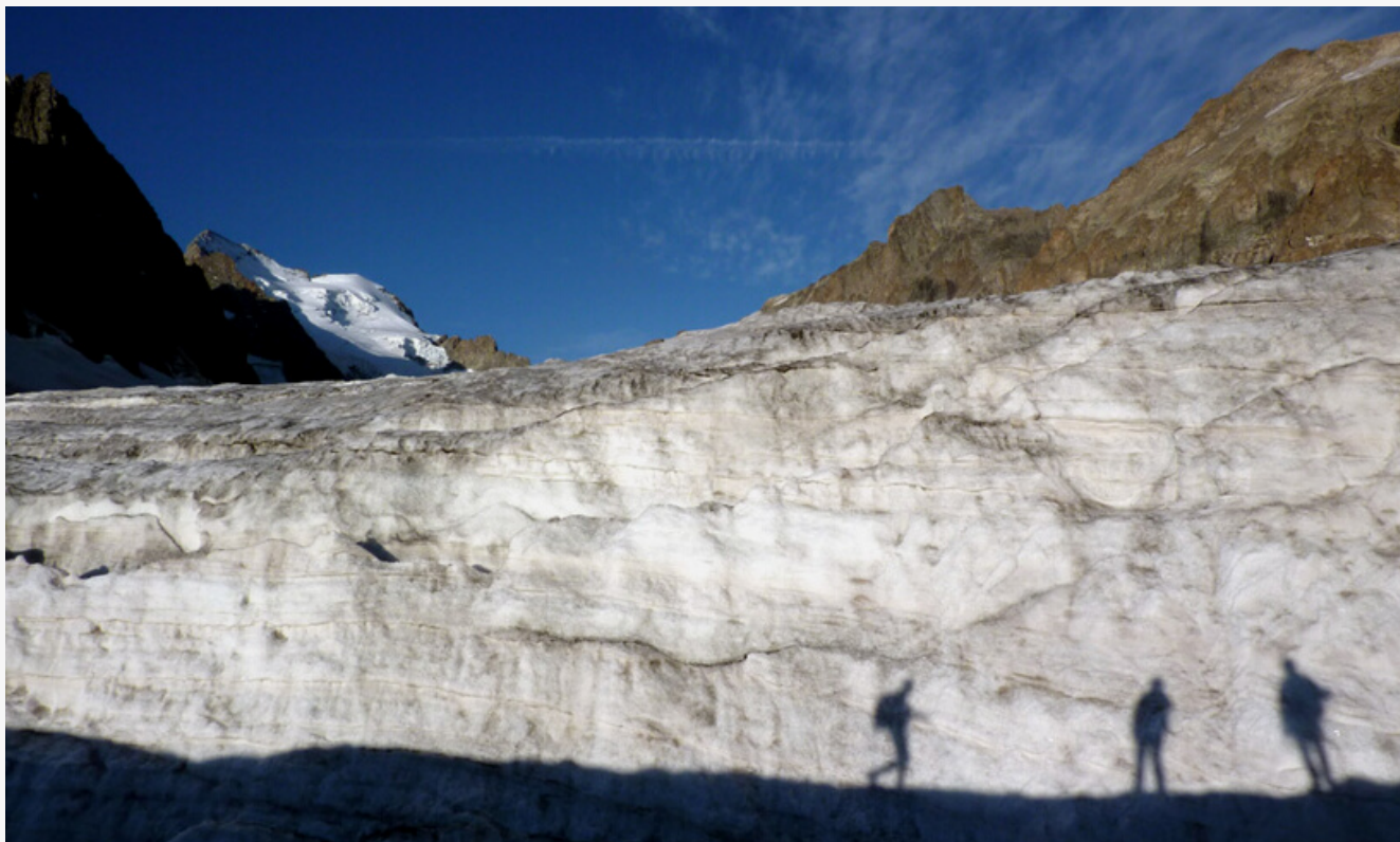
Glacier blanc, la barre et le dome des Ecrins en arrière plan