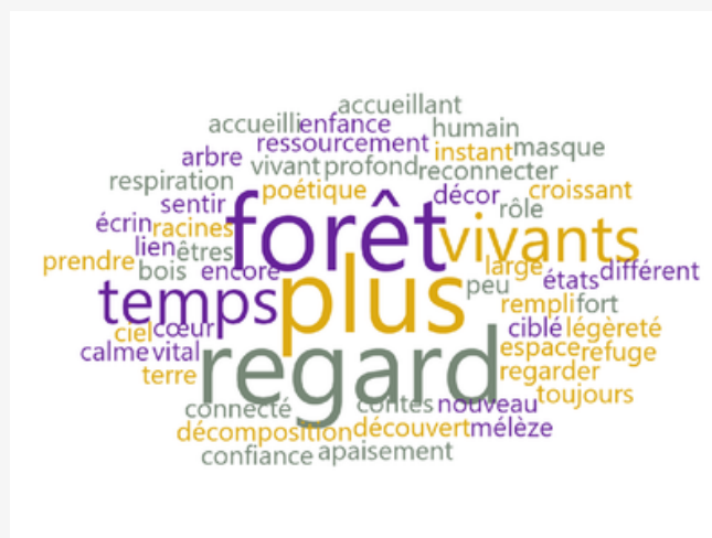
Crédit - Cultures Eco-Actives / Atelier en France "Lien à la forêt après le workshop"

Le projet montre que l'intégration du vécu des participants renforce la portée artistique de la démarche. Ces retours ne sont pas traités comme une évaluation externe, mais comme une matière sensible permettant d'ajuster les propositions et d'affiner les processus. Ils articulent perception cognitive, expérience corporelle et imaginaires culturels*, sans hiérarchisation entre ces dimensions.