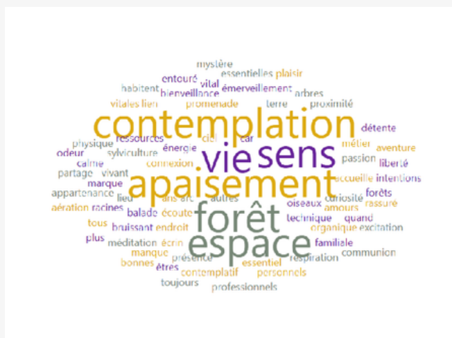
Crédit - Cultures Eco-Actives / Atelier en France "Lien à la forêt avant le workshop"

Chez les adolescents et les adultes, les transformations se manifestent par des changements de perception et de relation : attention prolongée au lieu, sensorielle et interactive ; témoignages évoquant une forêt perçue comme plus présente ou plus « vivante » et moins humaine, porteuse d'un état intérieur modifié. Lors de la performance en Norvège, la sensation d'être observé par la forêt a renversé la perspective habituelle entre observateur et observé ; l'expérience de la forêt a été déplacée, notamment vers une plus grande attention sensorielle et consciente de ses habitants.